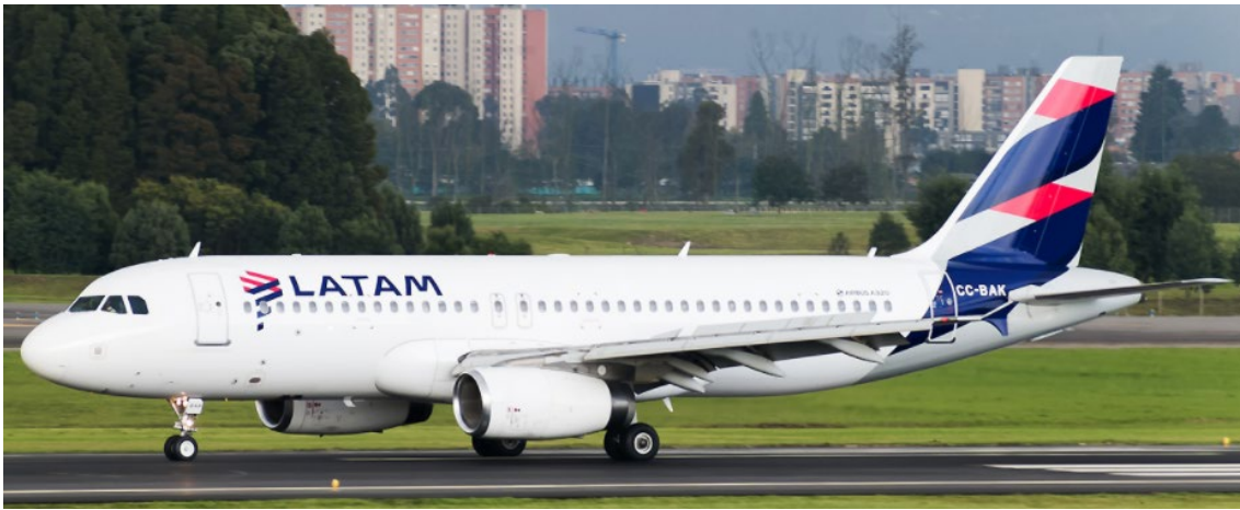
Figura 2. Airbus 320, CC-BAK

A la hora reportada, este avión sobrevolaba el océano frente a las costas de Cartagena a 39.000 pies, 476 nudos y rumbo 189°. Dependiendo de la localización exacta del testigo, pudo ser percibido con las características reportadas. (Figuras 2 y 3)