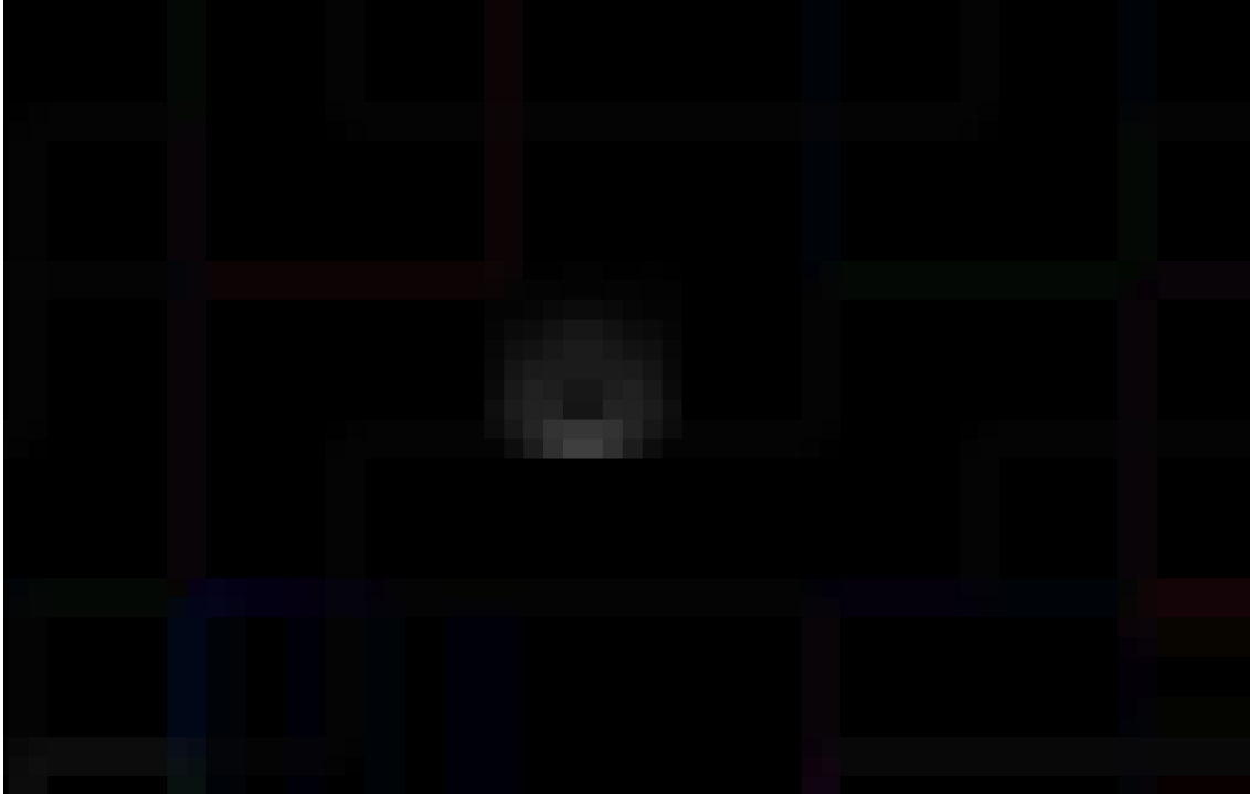
Figura 2. Silueta del fenómeno reportado con 1.600 aumentos.