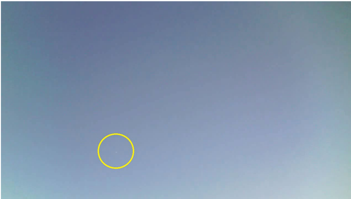
Figura 1. Uno de los fotogramas de la filmación. Al centro del círculo se encuentra lo reportado.

De los aproximadamente 20 segundos de grabación, se extrajeron y analizaron 600 fotogramas. La Figura 1 muestra al fenómeno reportado en el fotograma 505 de la filmación en estudio.