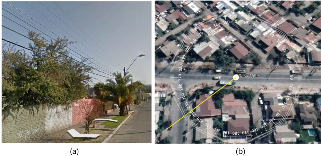
Figura 3. Escenario (a) y orientación aproximada de la filmación (b).

A partir de lo visible y del estudio geográfico, se determinó que antes de perderlo de vista, el objeto filmado se encontraba aproximadamente al suroeste de la usuaria (Figura 3).