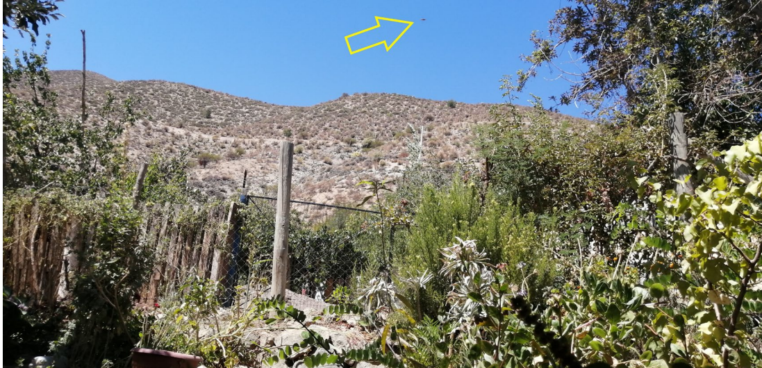
Figura 1. El objeto reportado figura apuntado por la flecha amarilla.

Las dos imágenes que apoyaron al reporte fueron periciadas mediante análisis de ELA (Error Level Analysis) y CMF (Falsificación por Copia y Movimiento) constatando que no fueron alteradas digitalmente. El estudio de la información contenida en sus metadatos confirmó que los archivos eran originales, pero corrigió la fecha y hora reportada para las 14:19 (HL) del 26 de febrero de 2021.