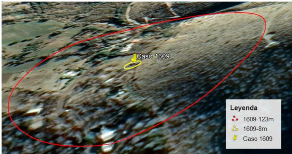
Figura 3. Distancias.

De acuerdo a este lugar y lo visible en la Figura 1 y distancias calculadas en la Figura 3, el objeto reportado se desplazó frente al fotógrafo, en rumbo general norte a sur, a menos de 10 metros suyo. Por lo mismo fue más cercano y pequeño que lo señalado, lo que es congruente con que solamente fuera visto al revisar la fotografía y no al tomarla puesto que el usuario estaba concentrado