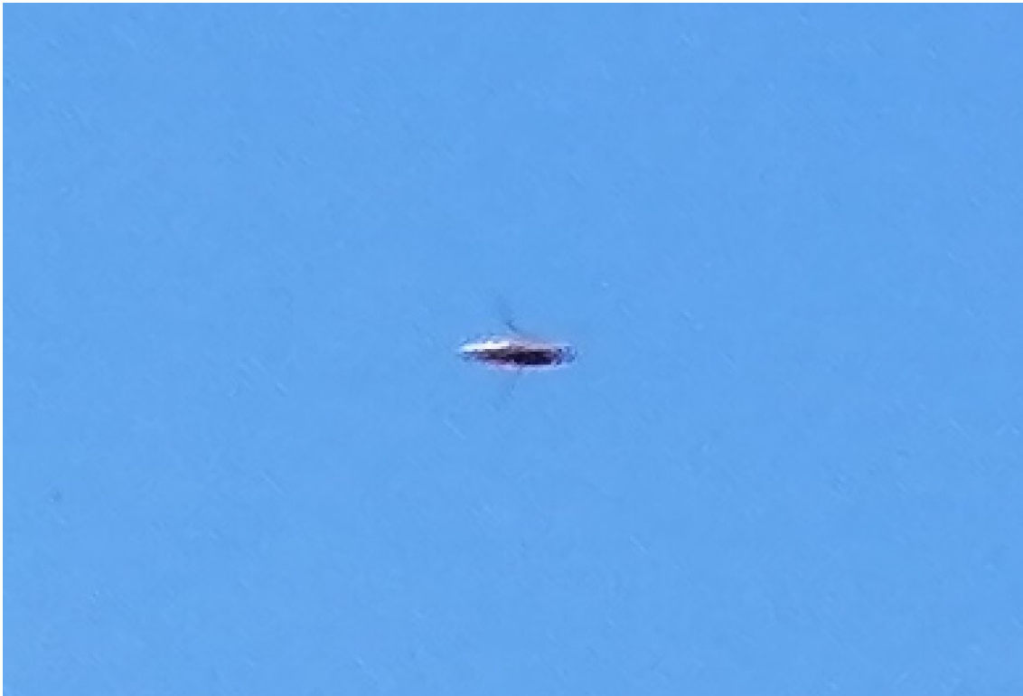
Figura 4. Lo reportado visto con 300 aumentos.

La Figura 4 muestra lo reportado con 300 aumentos.