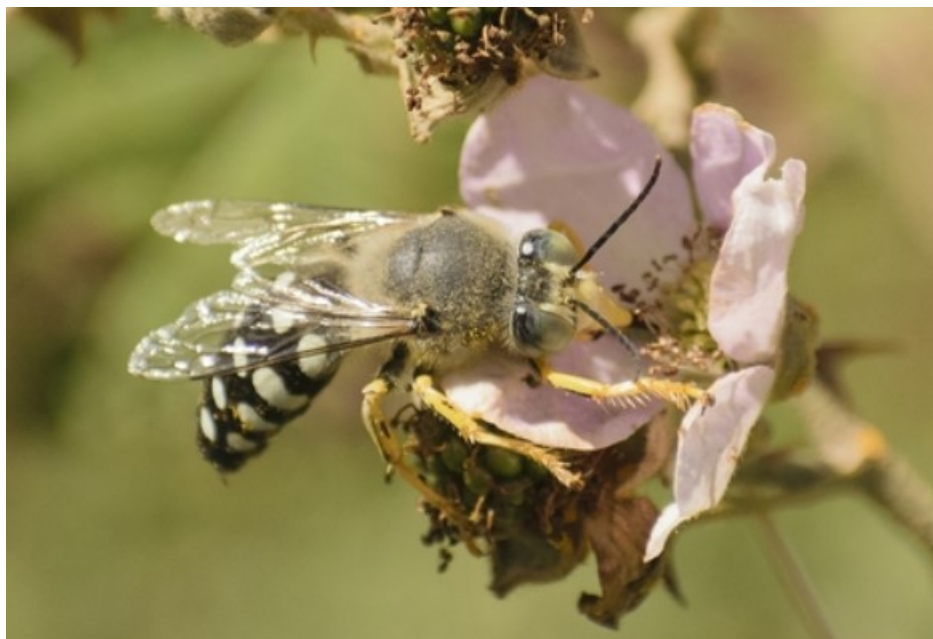
Figura 6. Zyzzyx chilensis .

Imágenes: Dos fotografías en formato JPG.