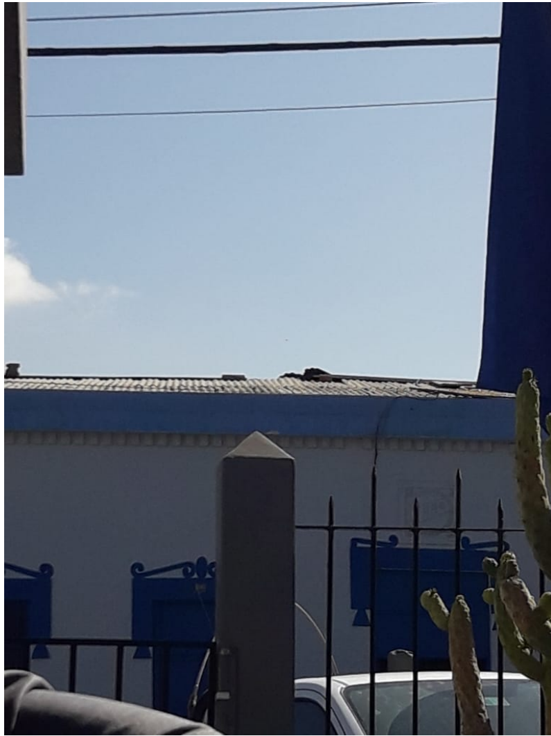
Figura 6. Imagen enviada por la informante.

Conclusión: De acuerdo al análisis del testimonio y de los resultados de los estudios forense, fotográfico y del tráfico aéreo, se concluyó que existe una alta probabilidad que lo reportado correspondiera al vuelo SKU SKU326 de Sky Airlines entre el Aeropuerto Internacional Arturo Merino Benítez (SCEL) de Santiago y el Aeródromo Diego Aracena (SCDA) de Iquique.