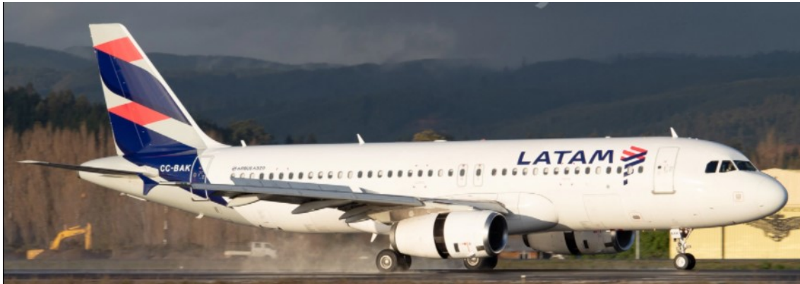
Figura 2. Aeronave CC-BAK

A las 18:16 esta aeronave volaba a 479 nudos hacia el sur, con rumbo 189°, y se encontraba a 38.975 pies de altitud. (Figura 3)