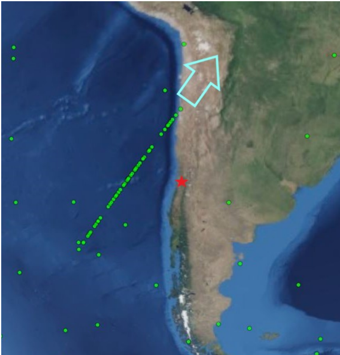
Figura 4. Satélites Starlink a las 06:04 (HL) del 31 de octubre de 2020. Su rumbo se marca con una flecha celeste, mientras que con una estrella roja aparece la ubicación del usuario.

Estuvo formada por los siguientes satélites: Starlink 1930, 1924, 1926, 1925, 1928, 1865, 1923, 1894, 1934, 1931, 1883, 1834, 1933, 1835, 1922, 1892, 947, 1943, 1833, 1929, 1932, 1835, 1948, 1936, 1935, 1939, 1798, 1946, 1941, 1944, 1872, 1942, 1848, 1949, 1921, 1937, 1911, 1899, 1908, 1910, 1920, 1945, 1905, 1898, 1847, 1896, 1893, 1882, 1851, 1897, 1903, 1918, 1902, 1917, 1901, 1919, 1916 y 1906.