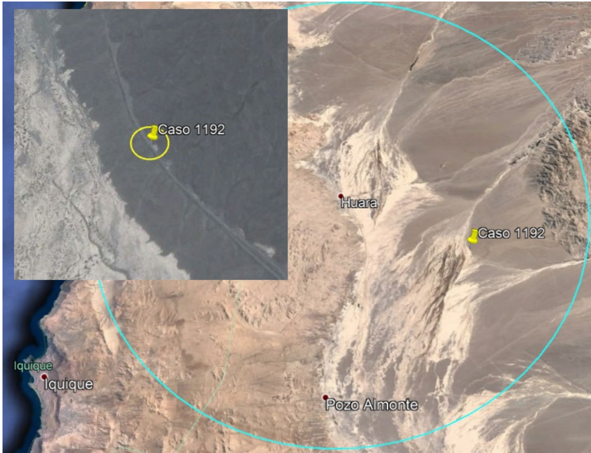
Figura 2. Ubicación reportada. Con un círculo celeste señala 35 kilómetros en torno a Huara y un círculo amarillo marca 60 metros desde el punto reportado.

Adicionalmente se determinó que el sector dónde se habría ubicado el usuario se encuentra a 11,8 kilómetros al sur de la Ruta 15 (Huara-Pisiga) y a 14,12 kilómetros al noroeste de la Ruta A-65 (Pozo Almonte-Mamiña).