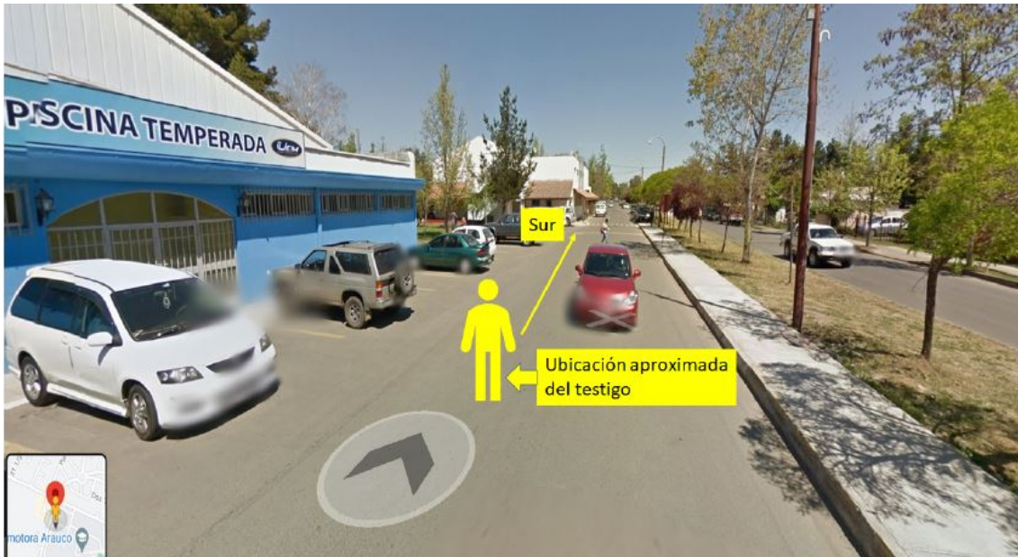
La imagen indica la posición aproximada del testigo, mirando hacia el sur.

A continuación se presentan tres imágenes con la localización del observador: