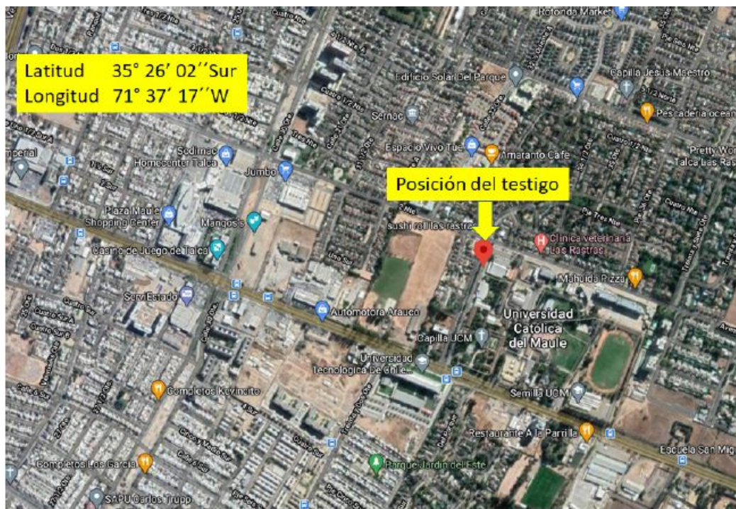
Vista satelital de la ubicación del testigo.