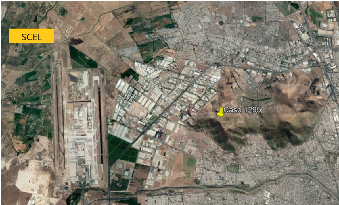
Figura 1. Localización del usuario y del Aeropuerto Internacional Arturo Merino Benítez (SCEL).

A partir de esta posición geográfica, se estudió el tráfico aéreo que pudiera ser visible el 18 de septiembre de las 17:30 a las 19:40 (HL). Se definió el paso de doce aeronaves, ninguna de las cuales realizó un desplazamiento como el reportado.