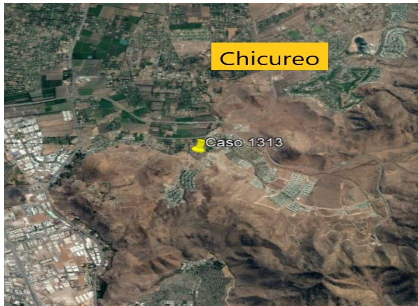
Figura 1. Localización aproximada del testigo.

A partir de esta información y de lo visible en la filmación, se estudió la situación astronómica sobre el usuario. Con ello se definió que la filmación fue realizada apuntando hacia el W-NW. La Figura 2 muestra esto y un cuadro extraído de la filmación.