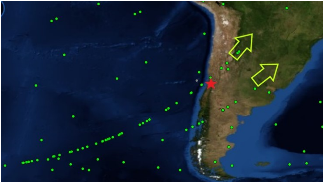
Figura 3. Paso de satélites del proyecto Starlink que originó el reporte. Una estrella roja señala la localización de Chicureo.

1700, 1671, 1694, 1692, 1663, 1696, 1682, 1709, 1706, 1644, 1729, 1676, 1702 y 1748. (Figura 3)