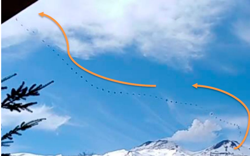
Figura 4. Desplazamiento de lo reportado al acercarse al usuario.

Junto con el patrón de desplazamiento (Figura 4), la variación de la silueta al moverse levantó la hipótesis de encontrarse frente al vuelo de un ave pequeña y rápida, por lo que se solicitó la opinión especializada independiente de un ornitólogo de la Universidad de Chile y asesor externo del CEFAA.