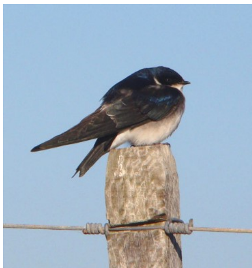
Figura 5. Tachycineta leucopyga .

También conocida como “pilmaiquén”, esta ave se distribuye desde el sur de Atacama a Tierra del Fuego y desde la costa hasta la precordillera. Su cuerpo mide de 13 a 14 centímetros y es negro, con brillos azulinos en la parte superior de la cabeza, cuello, dorso y lomo; las alas y cola de igual tono, pero con brillo metálico verdoso. Su pico es pequeño y negro, al igual que las patas. Su garganta, cuello delantero, pecho, abdomen y rabadilla son de plumaje blanco (Figura 5). Es un ave que vive en campos y ciudades.